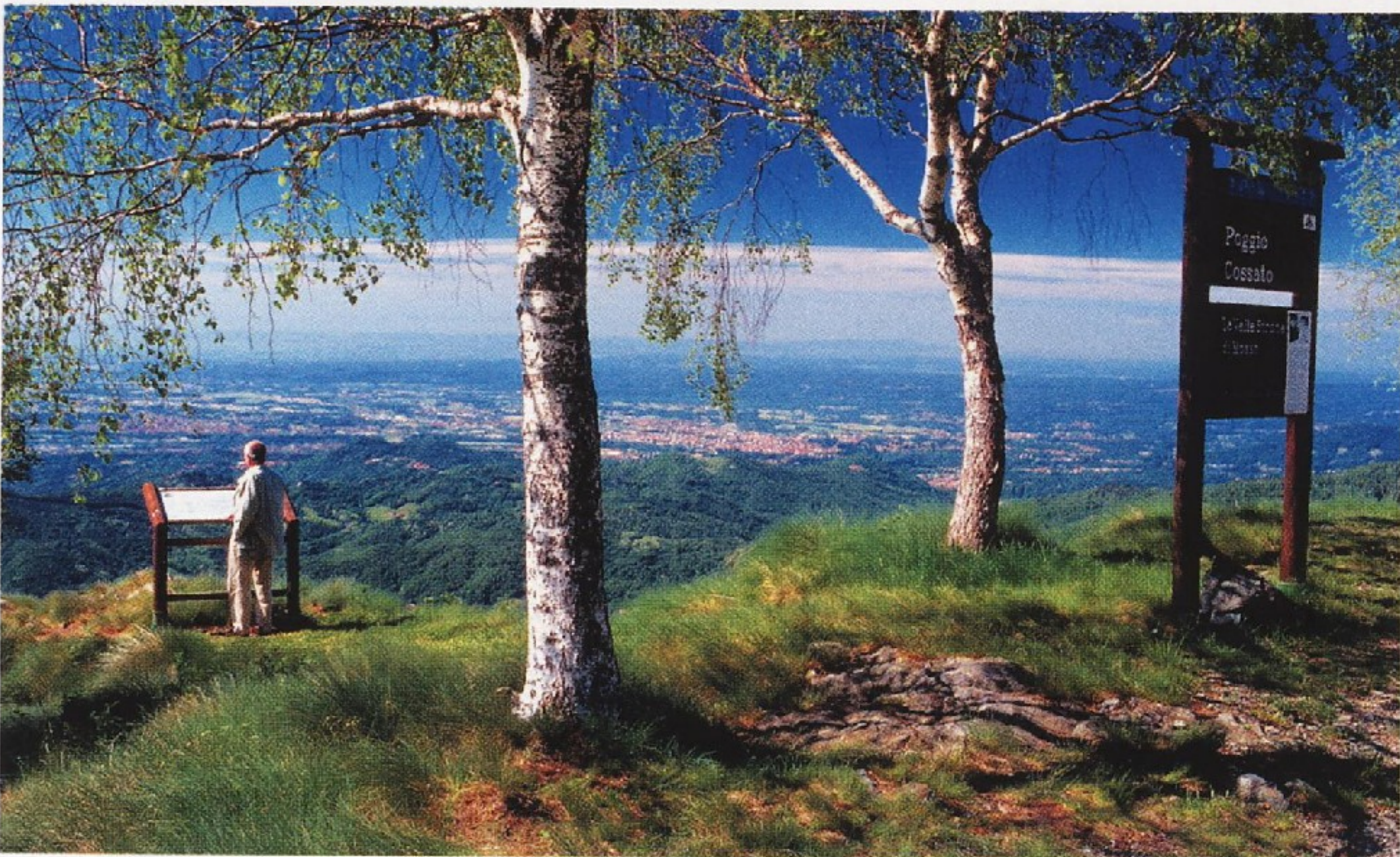
Sopra, dall'alto, l'Hotel Le Betulle, con campo da golf, a Magnano; uno dei punti panoramici dell'Oasi Zegna, nel Biellese.

colpì la zona, la città di Biella costruì una vera chiesa. Ovvero il primo passo di un complesso che negli anni vide al lavoro i più importanti architetti del tempo: Arduzzi, Gallo, Beltramo, Juvarra, Guarini, Galletti, Bonora. A fine Ottocento venne avviata la creazione della Basilica Superiore , dalle dimensioni monumentali, con lavori che proseguiranno durante le guerre mondiali. La consacrazione avvenne infatti nel 1960, con il moderno ciborio a opera di Gio Ponti . Le due chiese fanno parte di un complesso imponente, dichiarato dall'Unesco Patrimonio dell'Umanità e che domina dai suoi 1200 metri la verde vallata. Un connubio di fede e arte che offre al visitatore diciassette cappelle con statue in terracotta policroma che evocano la vita di Maria, il singolare cimitero, il Museo dei Tesori (con annesso l'appartamento dei Savoia), la biblioteca storica, le gallerie ex voto, i chiostri, il museo permanente dei presepi e i sentieri naturalistici. I.c.